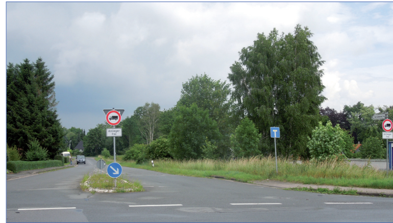
Unter Berücksichtigung der Interessen der Landwirtschaft ist mittelfristig ein Rückbau der Einfahrt zur Apelerner Straße in Trichterform eine Option, um unnötigen Lkw-Verkehr zu unterbinden.